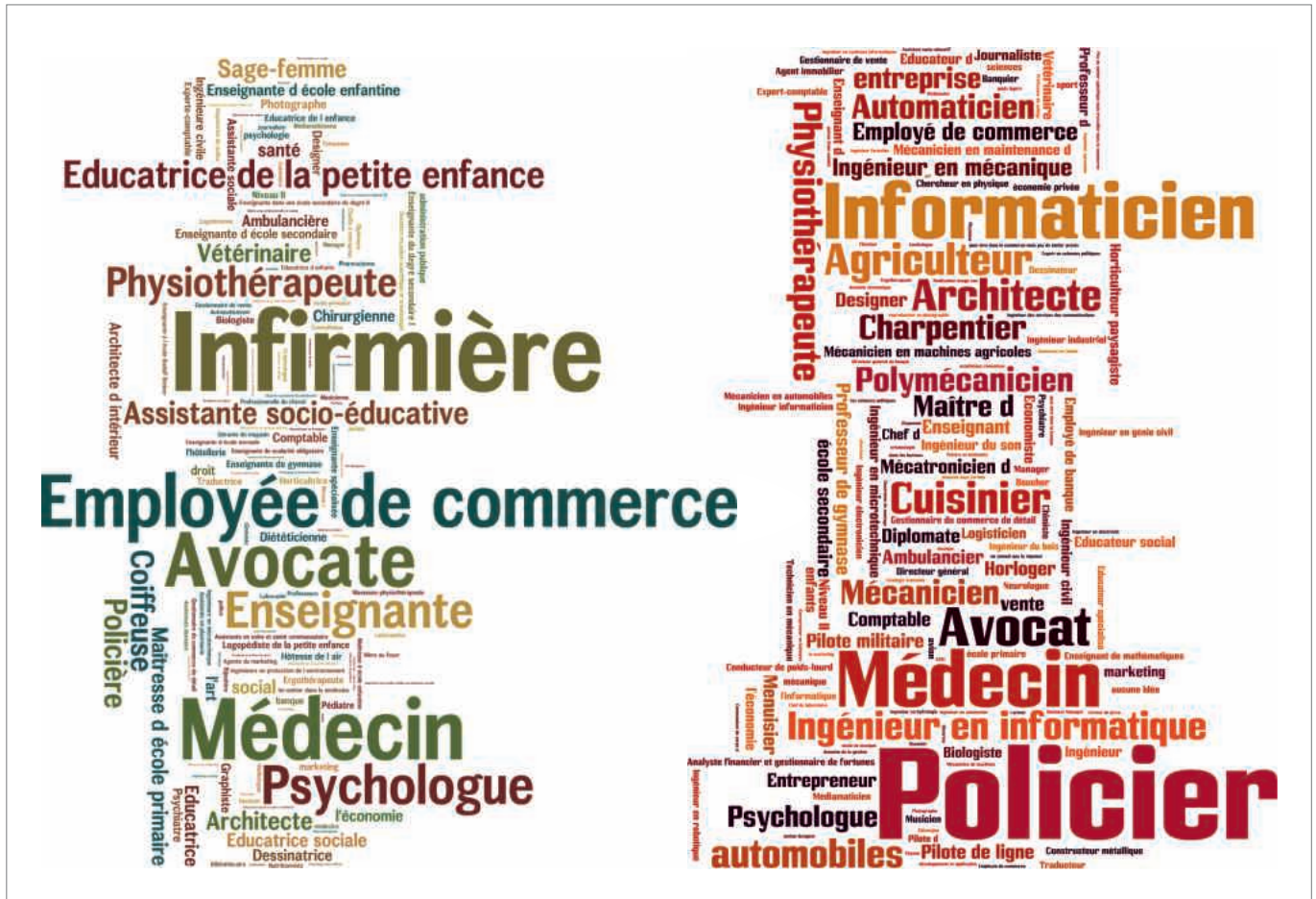
Graphique 2: Profession que vous pensez exercer à l'âge de 30 ans