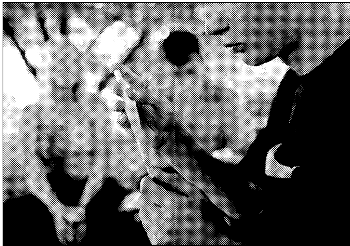
FUMETTE Seuls 7% des jeunes qui fument du cannabis à l'âge de 16 ans persistent dans leur habitude.

Résultat: le changement principal dans la consommation de