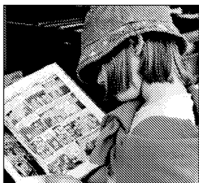
PASSION La joie de lire.

Ce hit-parade livresque constitue par ailleurs une mine d'idées pour les vacances d'été. Certes, les plébiscites des en-